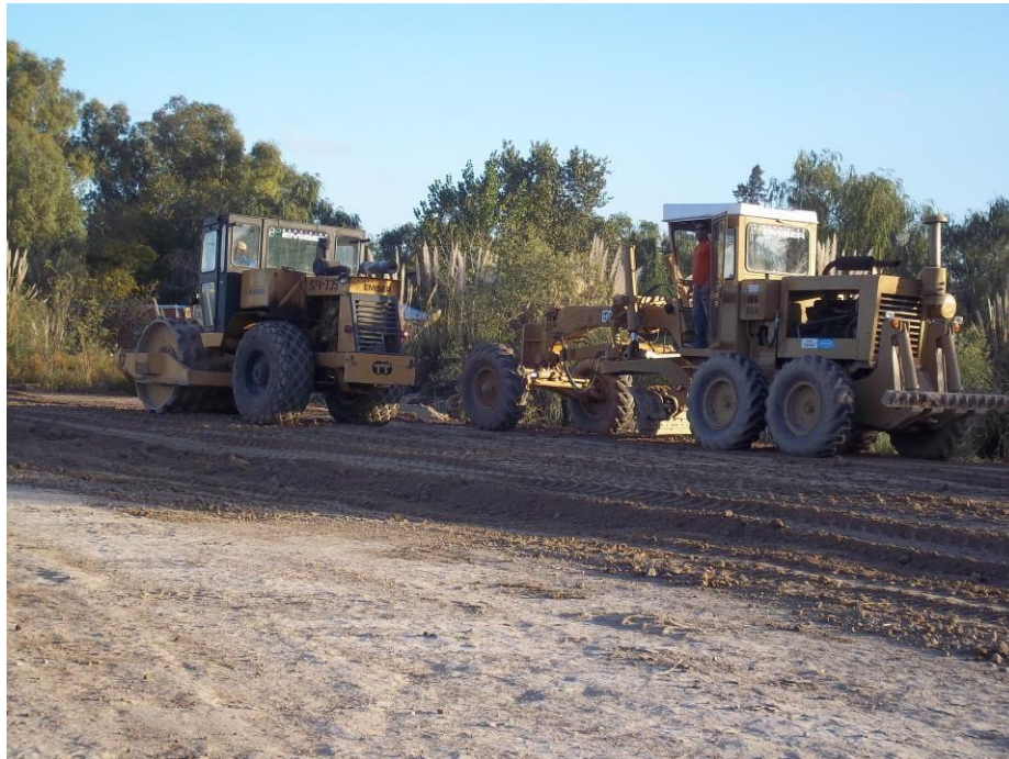
Compactador y motoniveladora en camino alternativo Nordelta