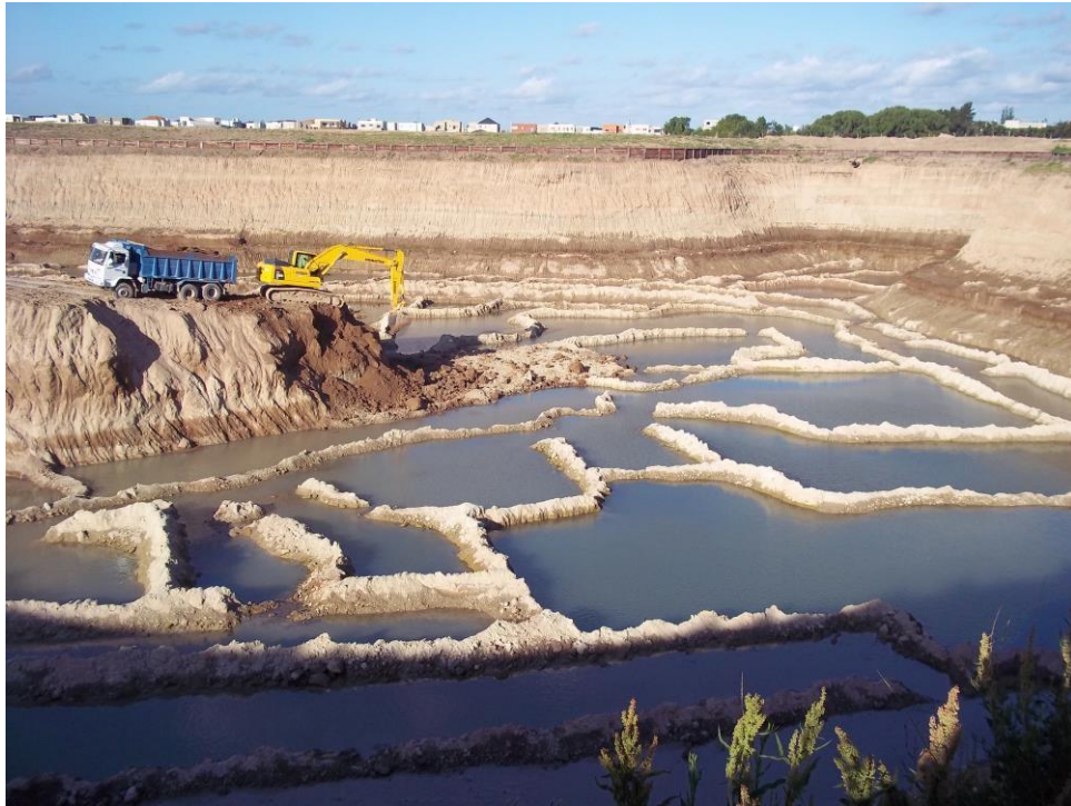
Movimiento suelo - Ciudad Pueblo Nordelta - Barrio Los Tilos