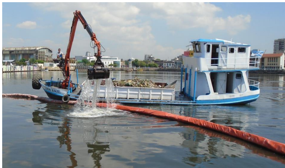
Barco DON RAUL con hidrogrúa y balde almeja