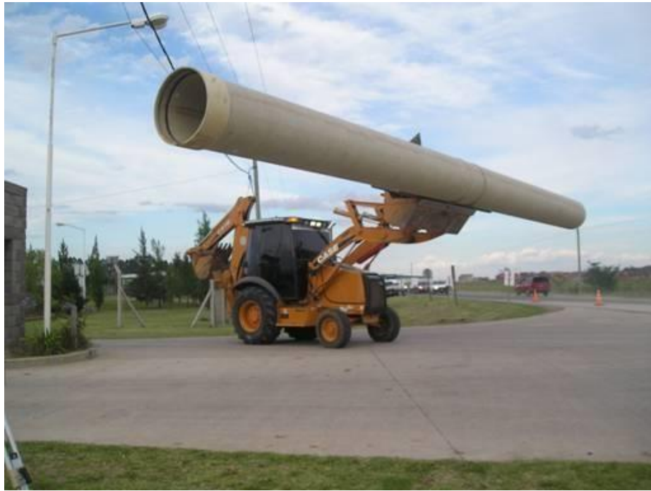
Pala-Retro 580 – tendido cañería PRFV Parque tecnológico Industrial Zarate