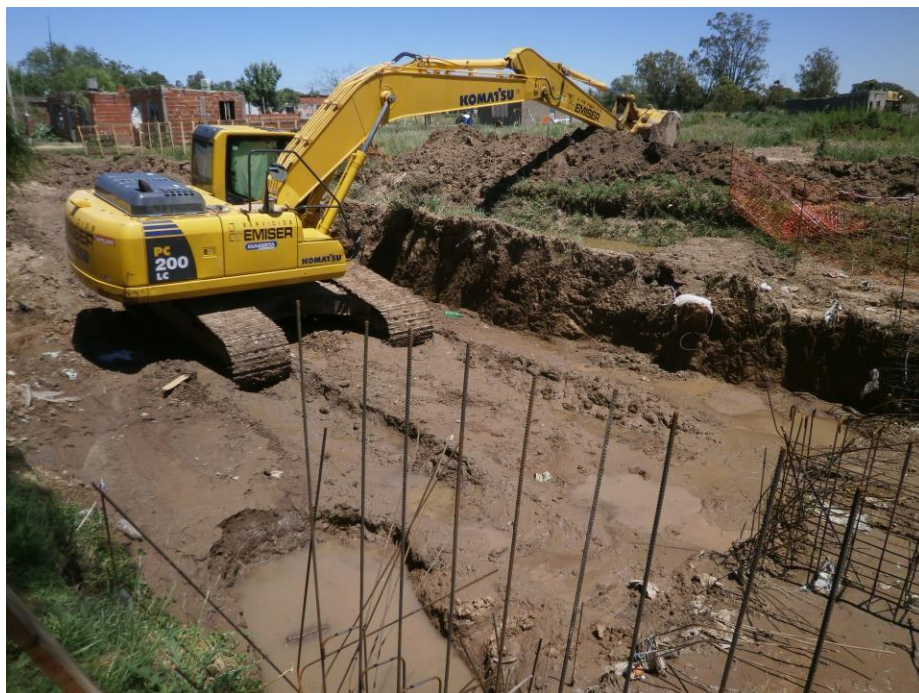
Retro excavadora Komatsu PC 200.