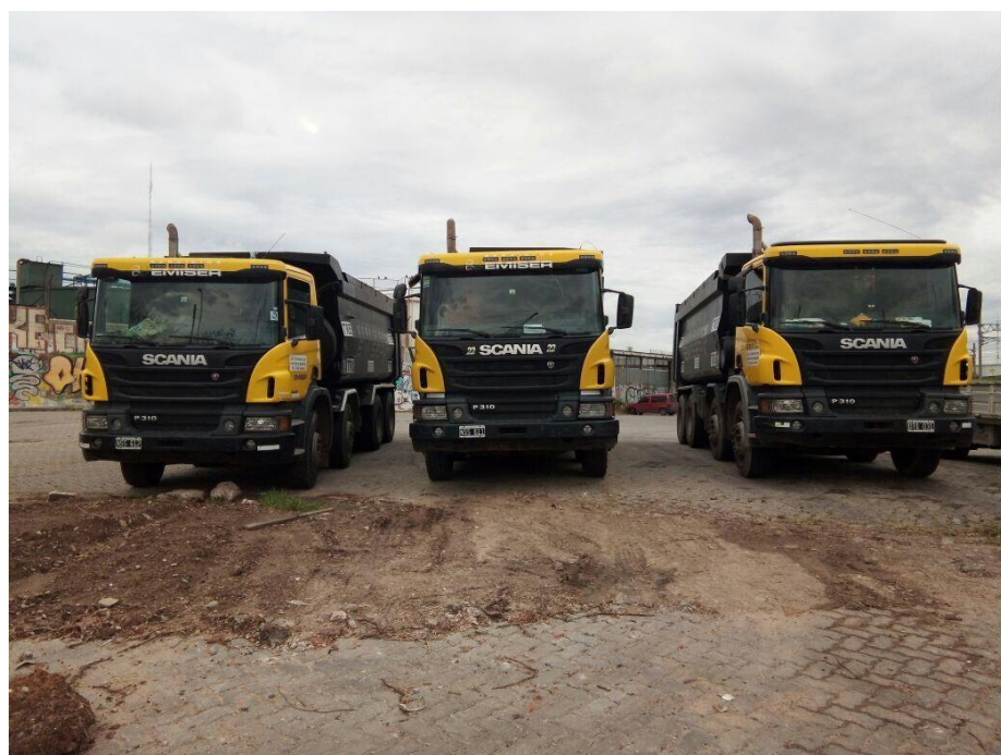
Camiones Scania 310 8x4 Frontal Tatu