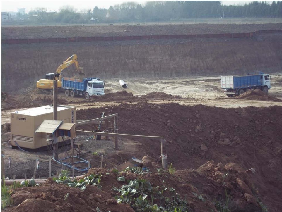
Movimiento suelo - Ciudad Pueblo Nordelta - Barrio Los Tilos