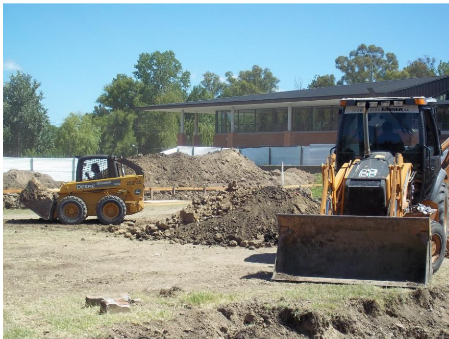
Minicargadora John Deere 320