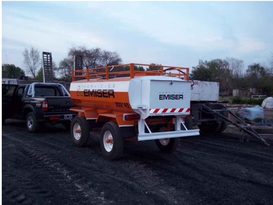
Tanque para combustible