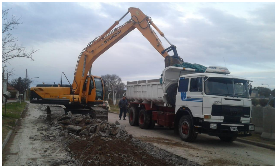
Retro excavadora HYUNDAI ROBEX 220 9S.