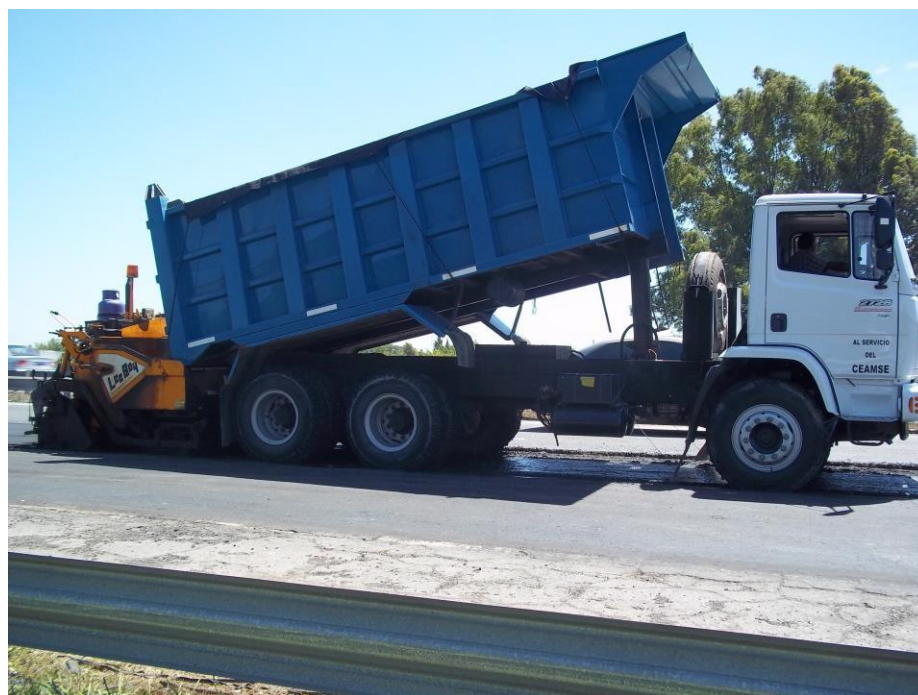
Camión Mercedes Benz 2726 k Frontal Tatu