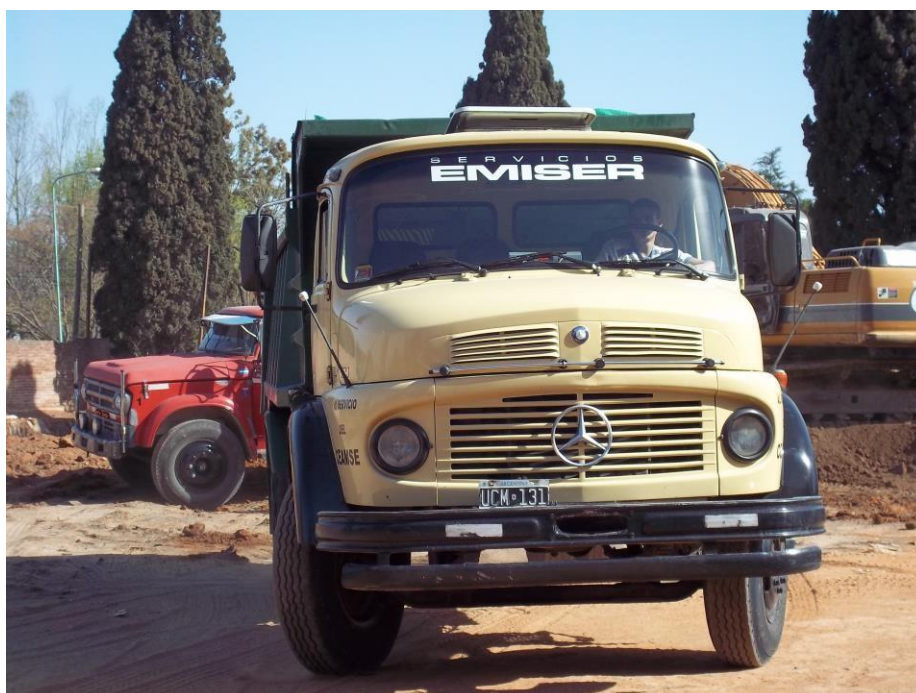
Camión volcador Mercedes Benz 1114