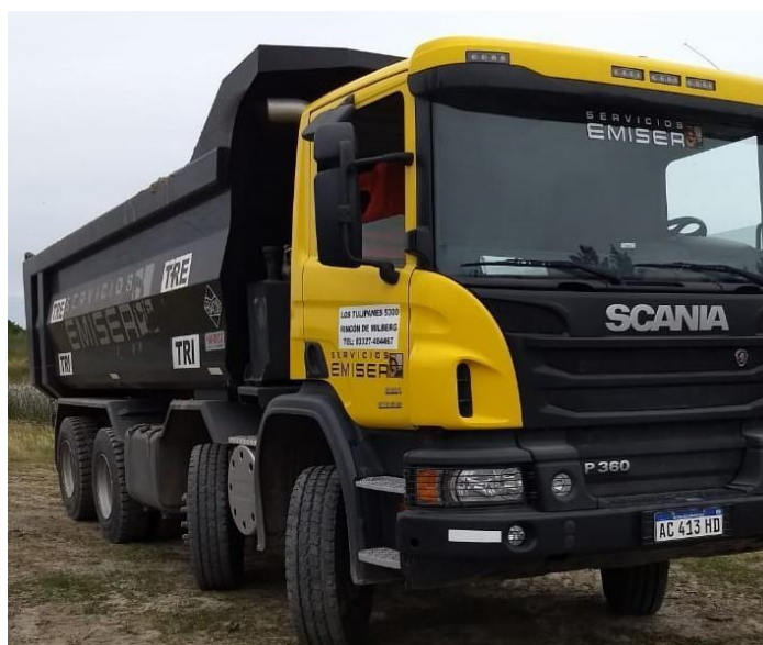
Camión Scania 310 8x4 Frontal Tatu