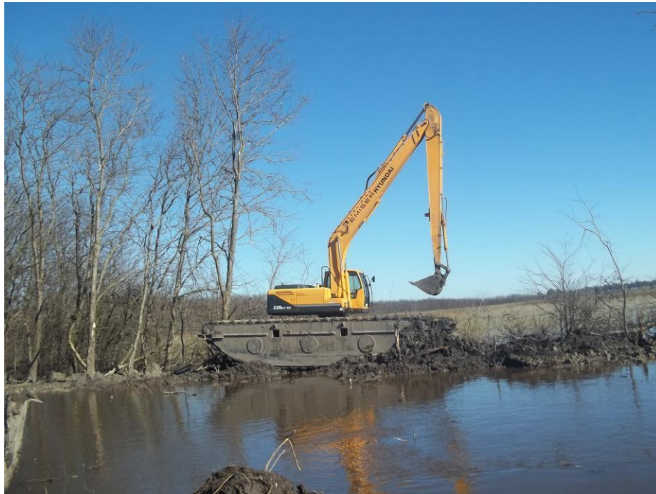
Retro excavadora ANFIBIA HYUNDAI 220 – LC - 95.