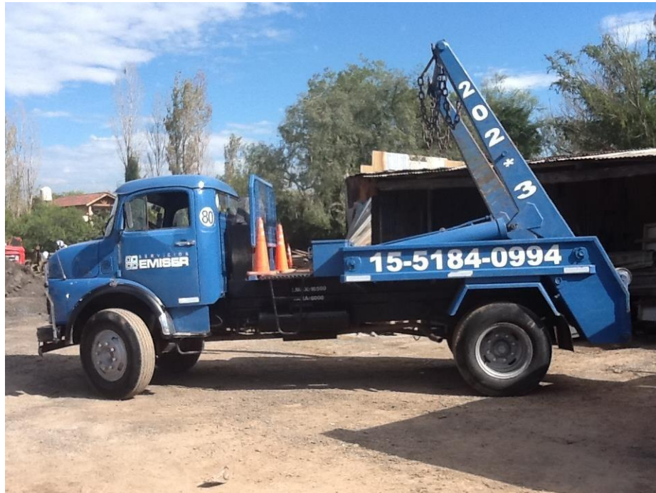
Camión Mercedes Benz con equipo porta volquetes