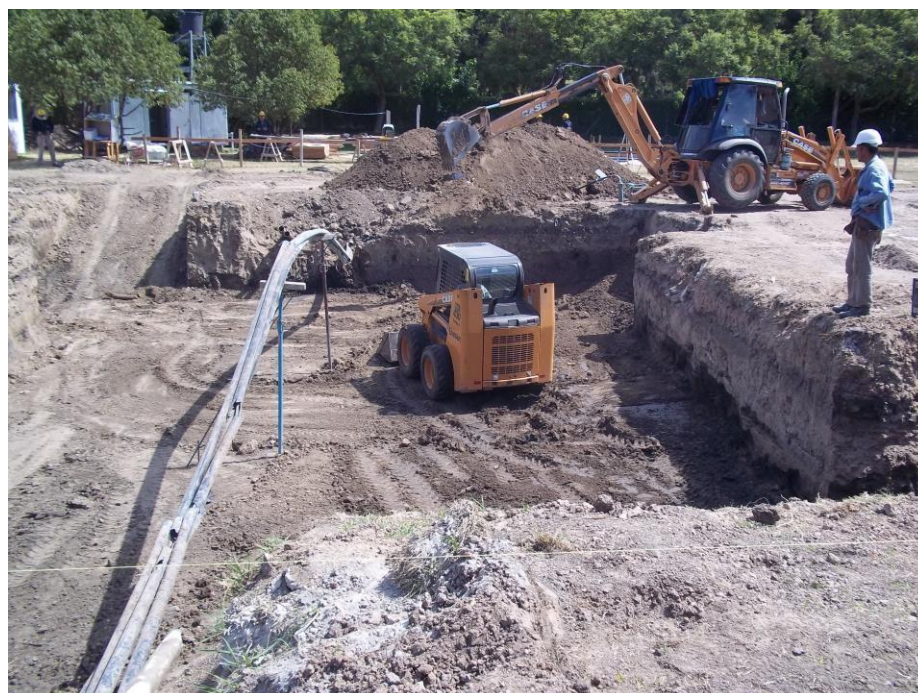
Minicargadora case 420