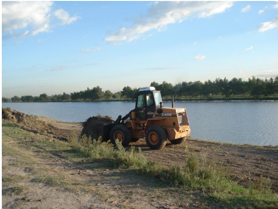
Pala cargadora Case W20E – Limpieza pista nacional de remo