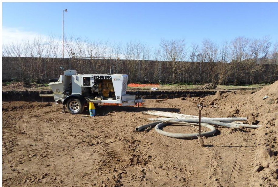
Bomba de Hormigón Schwing SP305