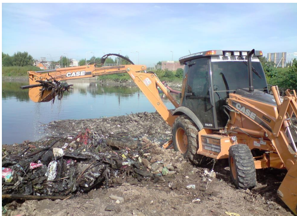
Extracción de sólidos residuos flotantes del Río Reconquista