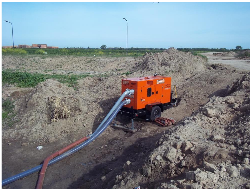
Ensanche Canal Las Tunas - Ciudad Pueblo Nordelta