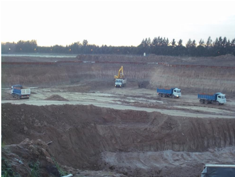
Movimiento suelo - Ciudad Pueblo Nordelta - Barrio Los Tilos