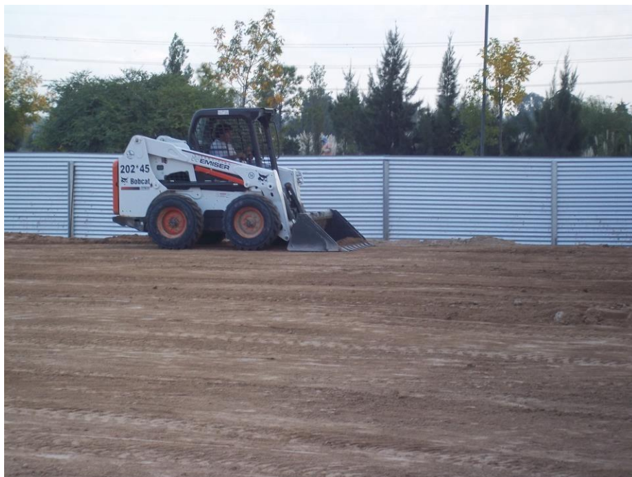
Minicargadora Bobcat S630 2012