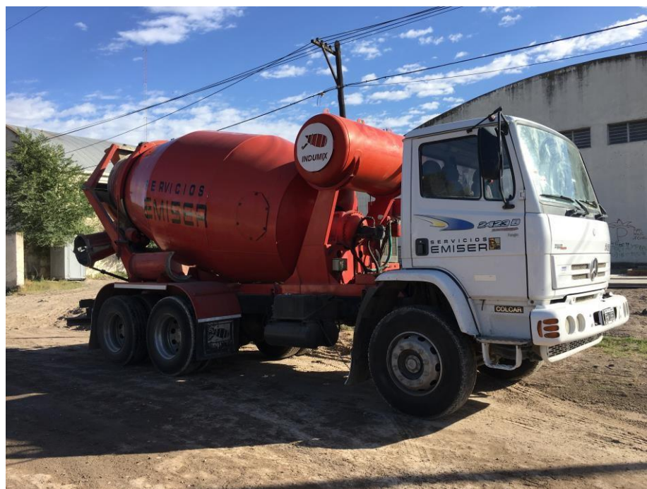
Camión mixer Mercedes Benz 177 – 2423 B