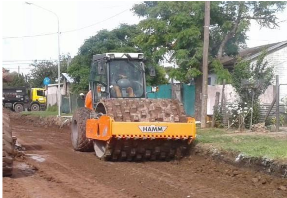
Compactador Hamm 3411