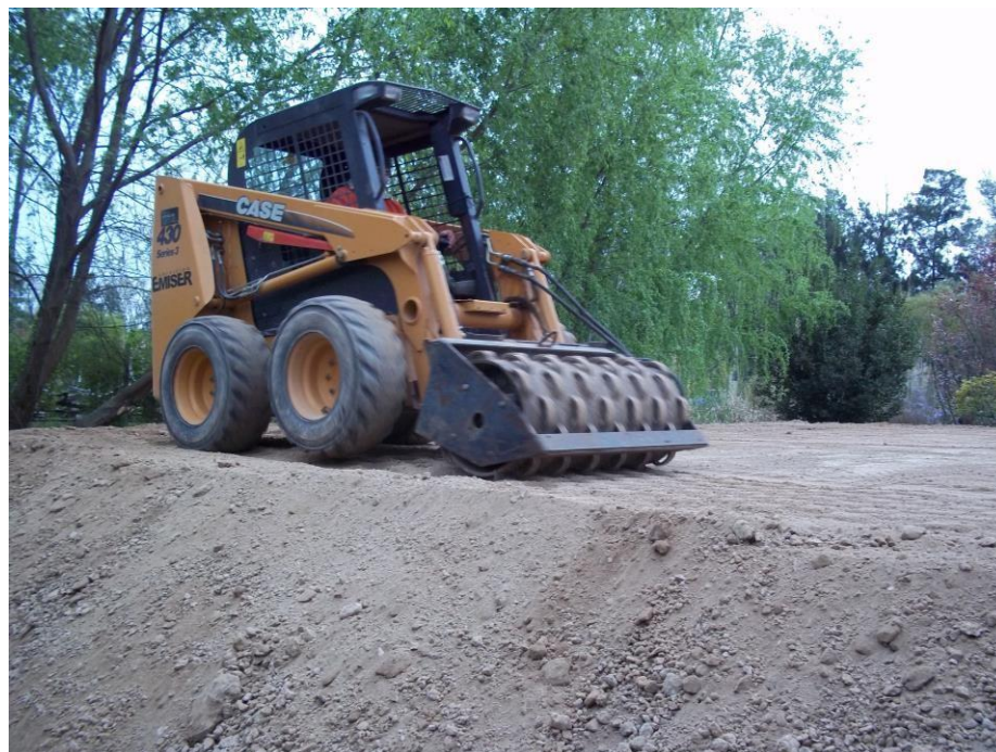
Minicargadora Case 430 con Rolo