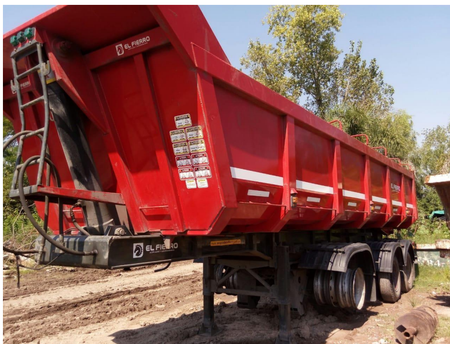
Batea El Fierro