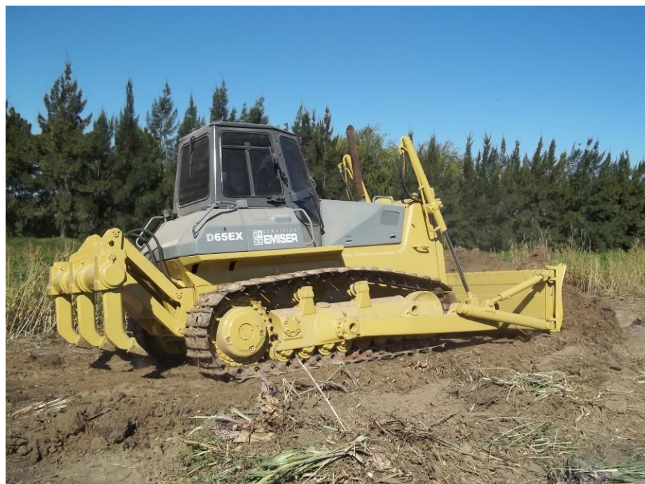
Topador Komatsu D65EX