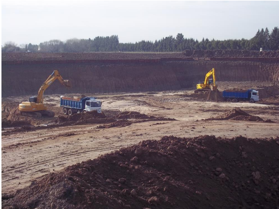
Movimiento suelo - Ciudad Pueblo Nordelta - Barrio Los Tilos