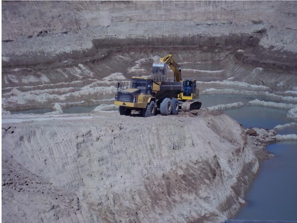
Movimiento suelo - Ciudad Pueblo Nordelta - Barrio Los Tilos