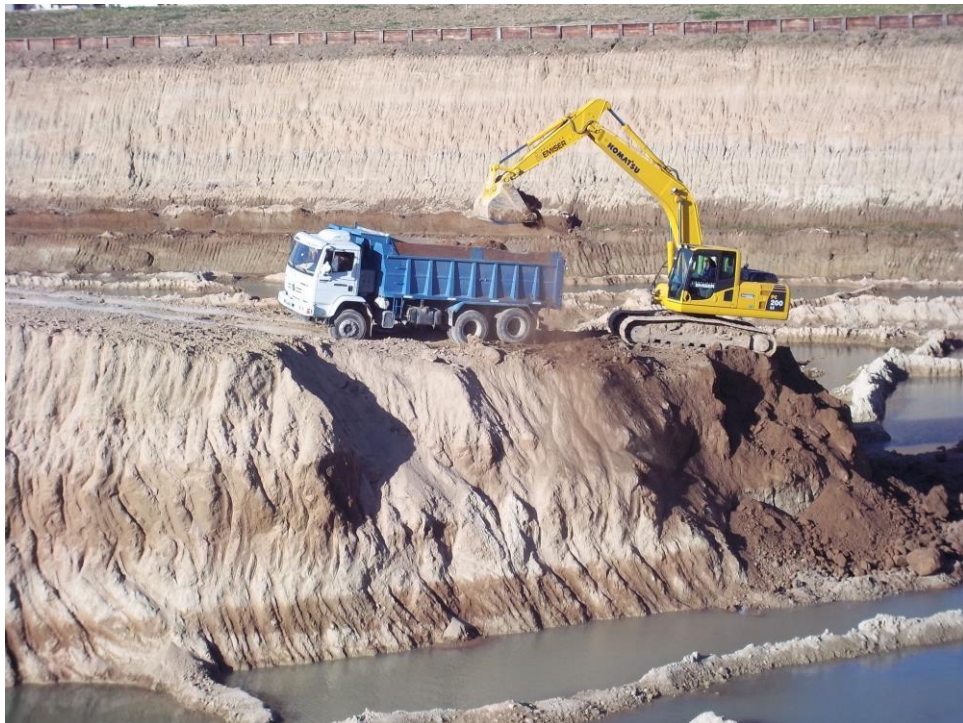
Movimiento suelo - Ciudad Pueblo Nordelta - Barrio Los Tilos