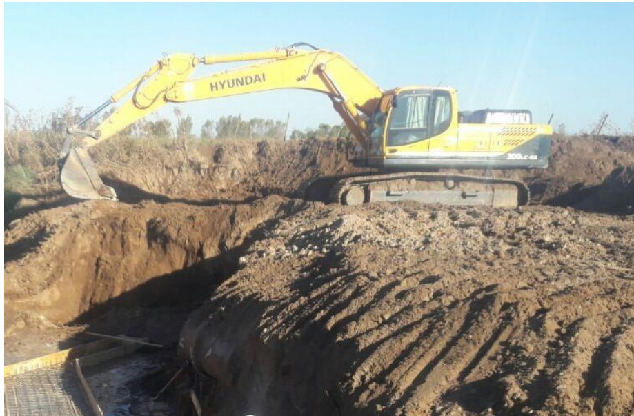
Retro excavadora HYUNDAI ROBEX 300 9S.