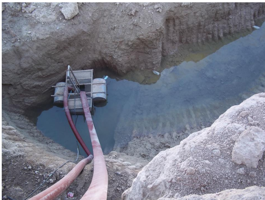
Bomba sumergible Flygt trifásica con salida de 6" 50lt x segundo