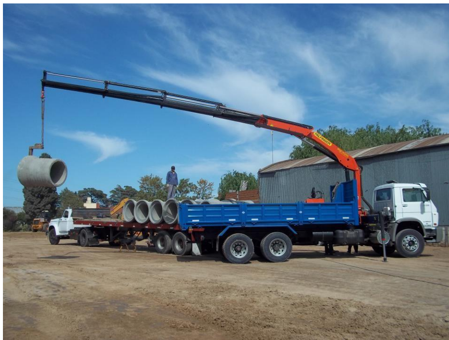
Camión Volkswagen 17-220 balancín con hidrogrúa 15tm