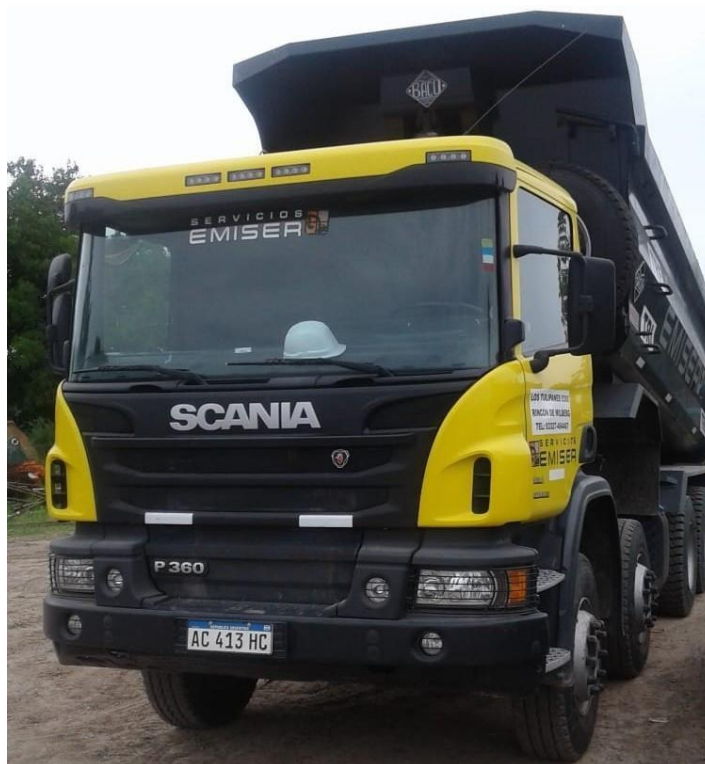
Camiones Scania 310 8x4 Frontal Tatu