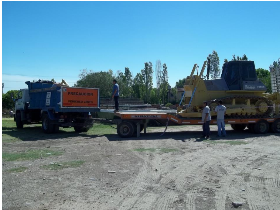
Carretón Manchini 25 Tn