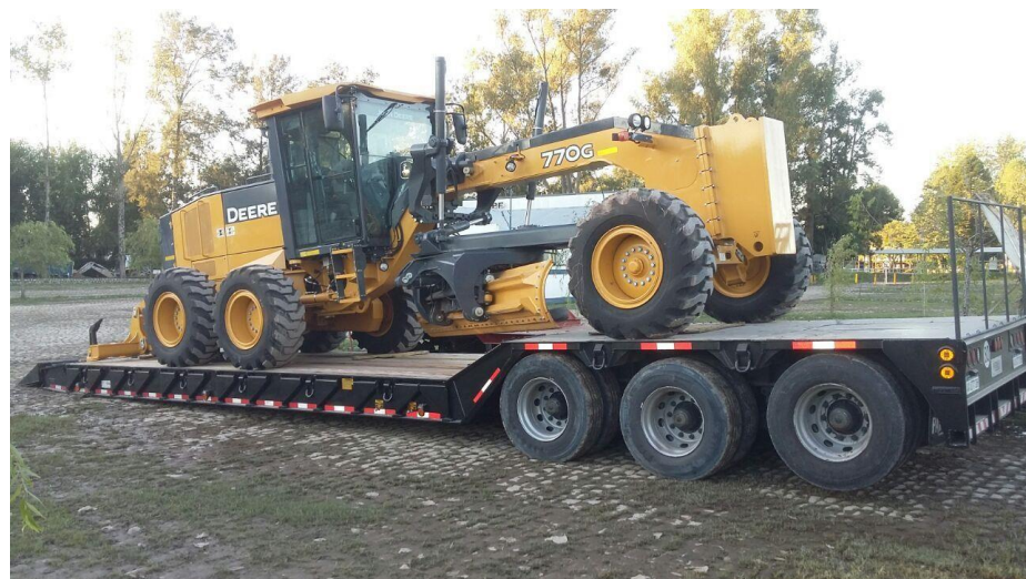
Motoniveladora John Deere 770G