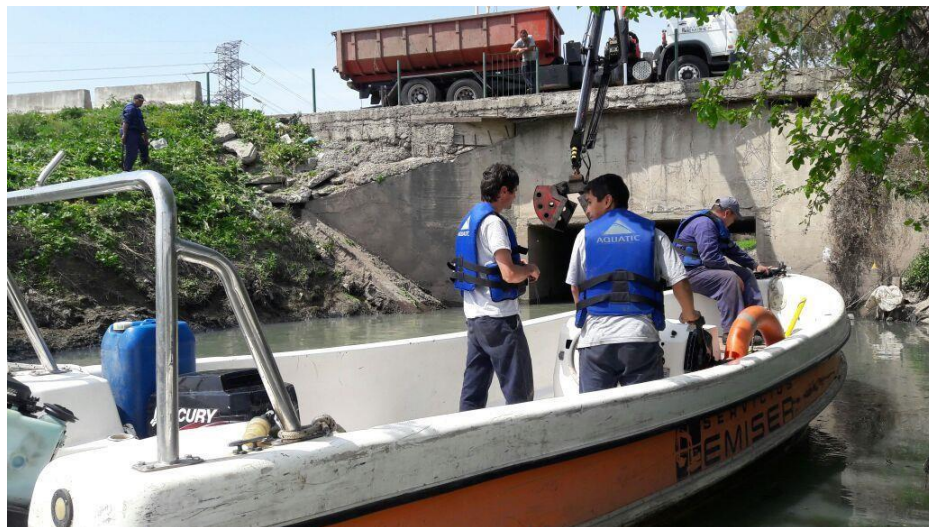
Tracker motor 90 HP