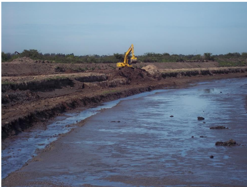
Ensanche Canal Las Tunas - Ciudad Pueblo Nordelta