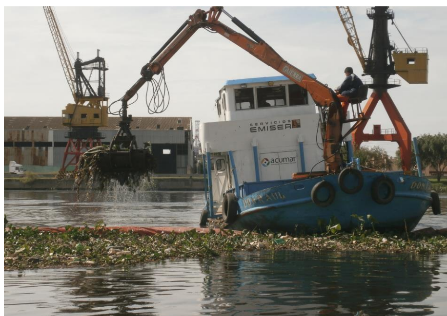
Barco DON RAUL con hidrogrúa y balde almeja