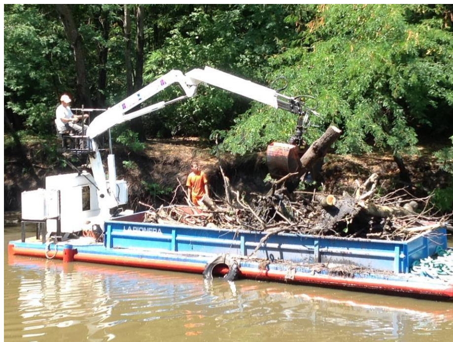
Barco tipo Chata autopropulsado con hidrogrúa y balde almeja