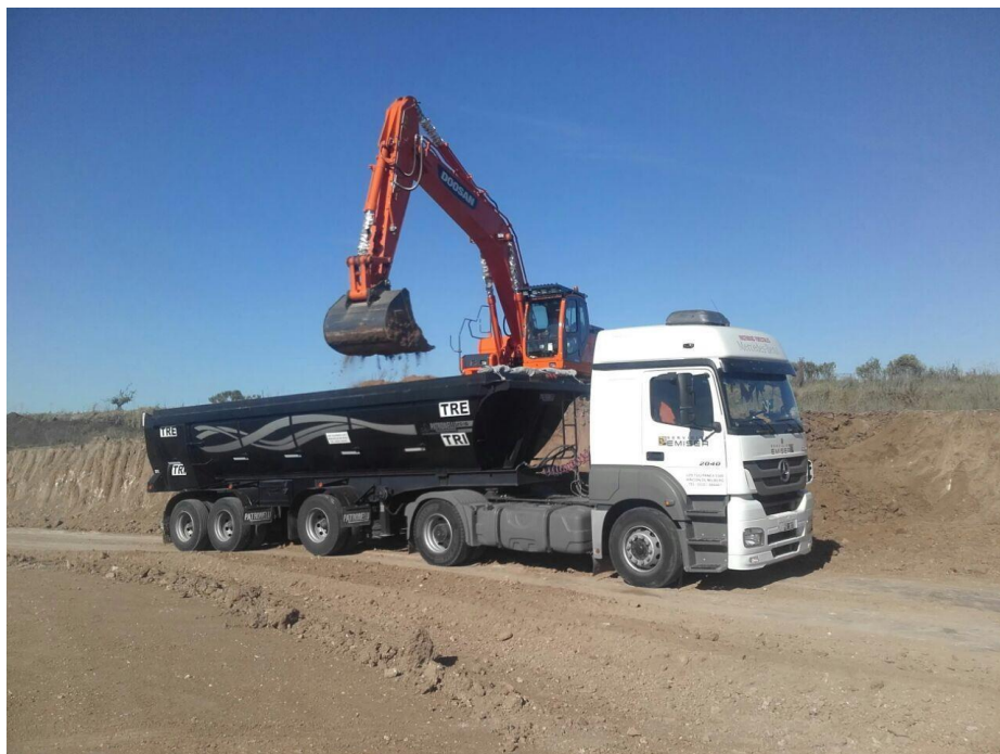
Camión Mercedes Benz Axor 2040S/36 Tractor