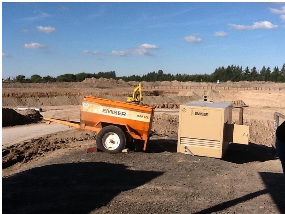
Grupo electrógeno 120 KVA