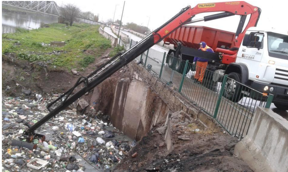
Camión Volkswagen 17-220 con equipo roll-off e hidrogrúa 26 tm.