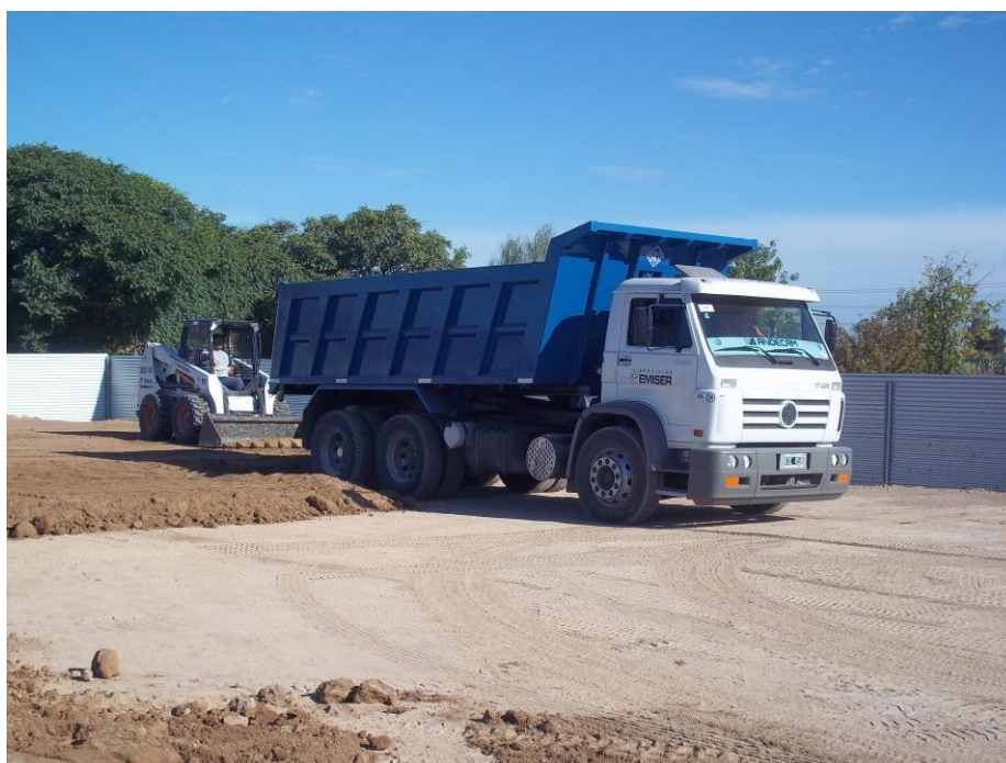
Camión volcador Volkswagen 17-220 balancín