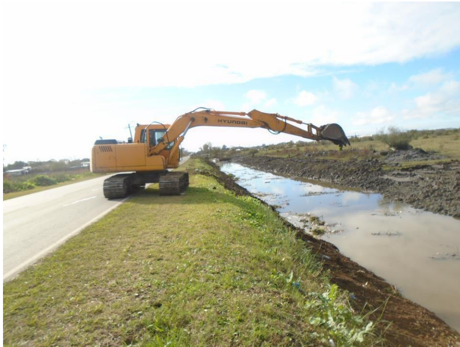
Retro excavadora HYUNDAI ROBEX 140 LC7.