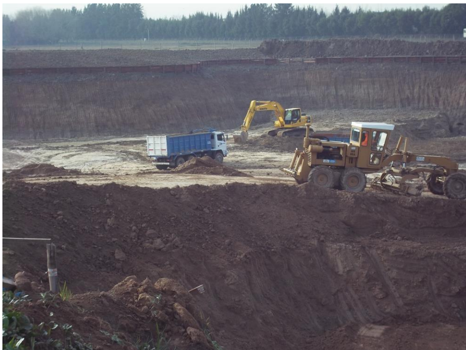
Movimiento suelo - Ciudad Pueblo Nordelta - Barrio Los Tilos