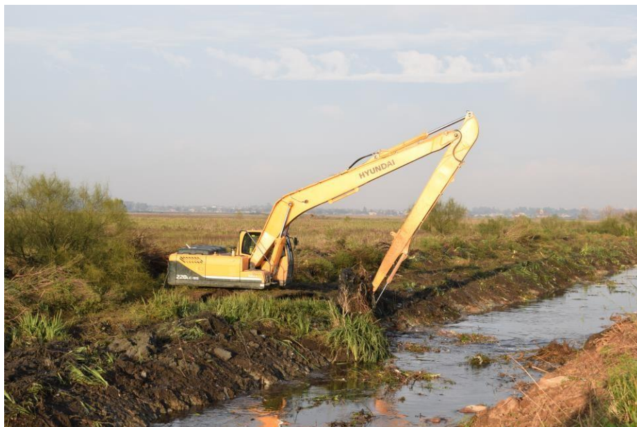
Retro excavadora HYUNDAI ROBEX 220 LC 9S.