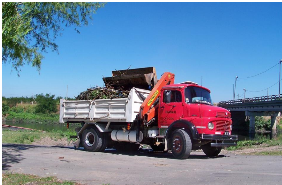
Camión volcador Mercedes Benz 1114 con Hidrogrúa