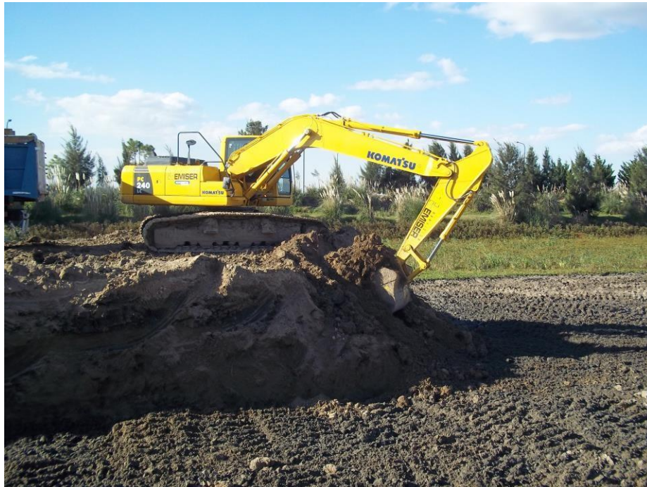
Retro excavadora Komatsu PC 240.