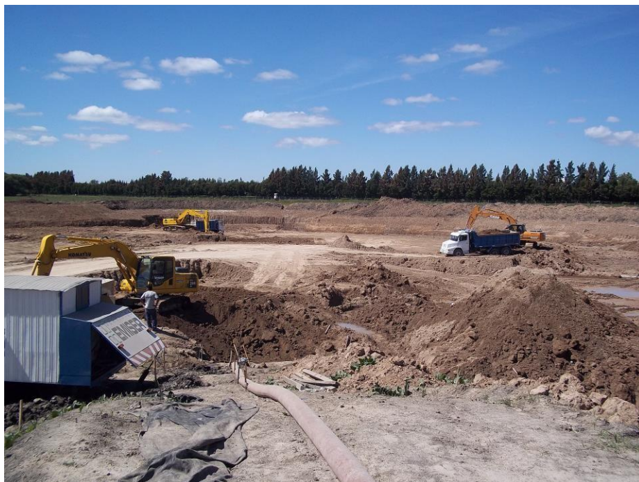
Cantera barrio Los Tilos prox. Laguna - Nordelta-