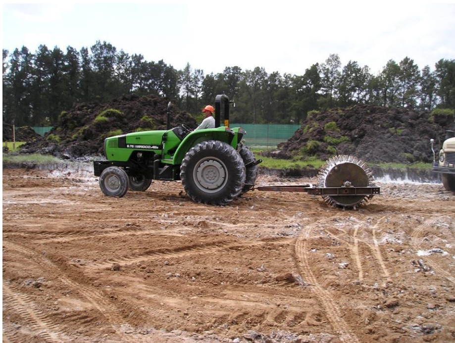
Tractor Agco Allis 675