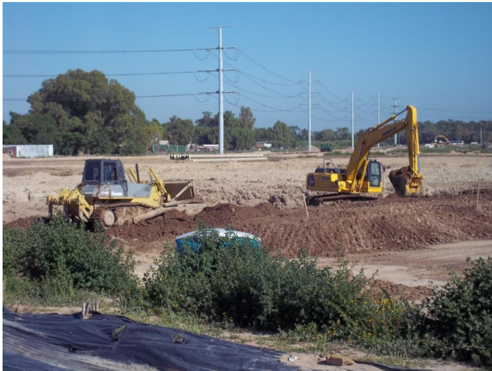
Movimiento suelo - Ciudad Pueblo Nordelta - Barrio Los Tilos