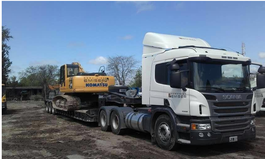
Camión Scania P 360 6x4 Tractor