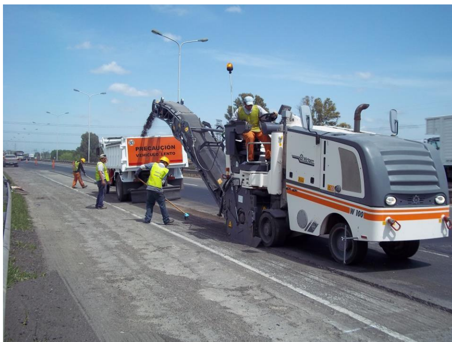
Fresadora Wirtgen W100 2011