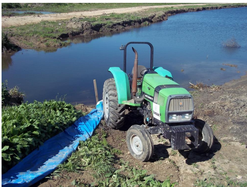
Ensanche Canal Las Tunas - Ciudad Pueblo Nordelta