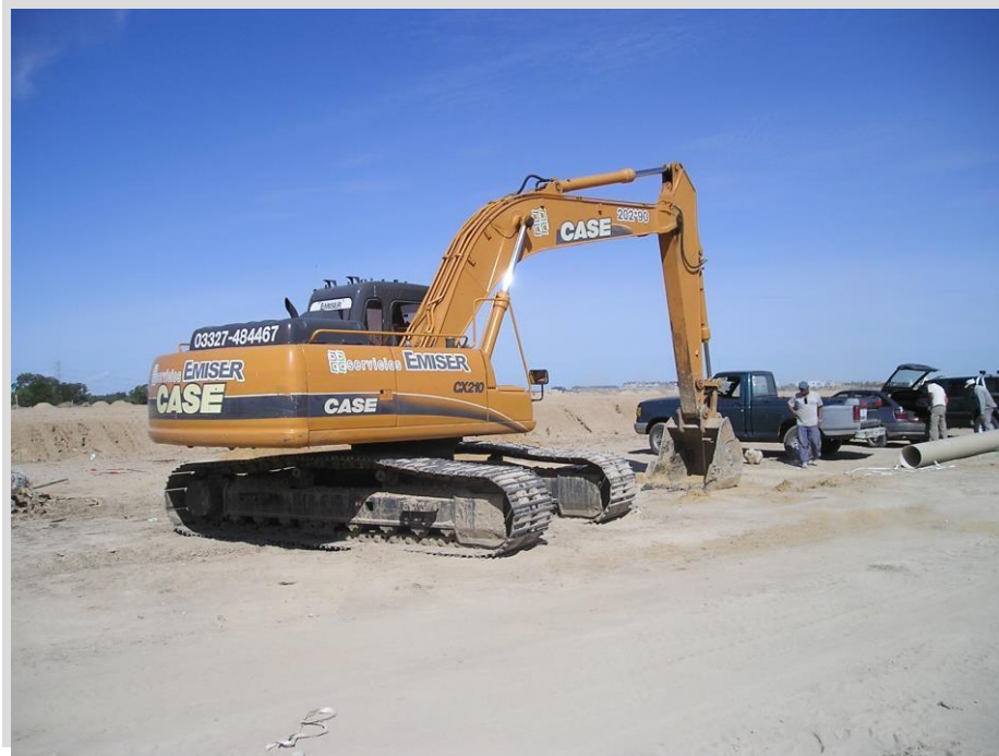
Retroexcavadora CASE CX 210