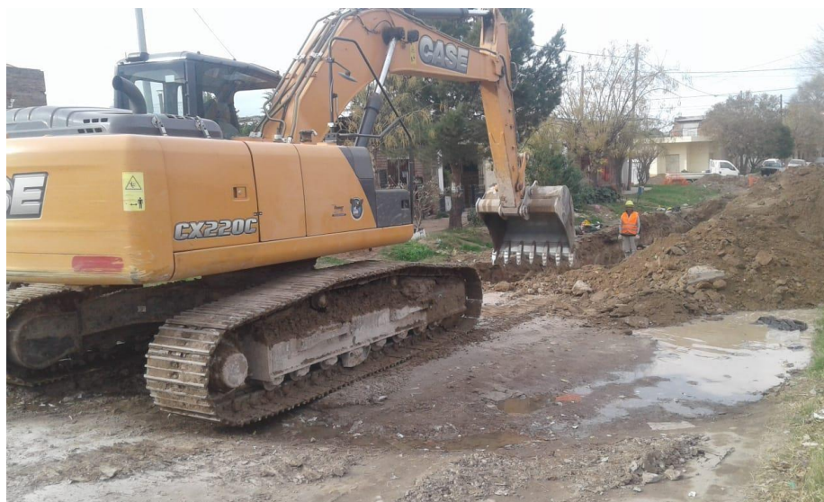
Retroexcavadora CASE CX 220C