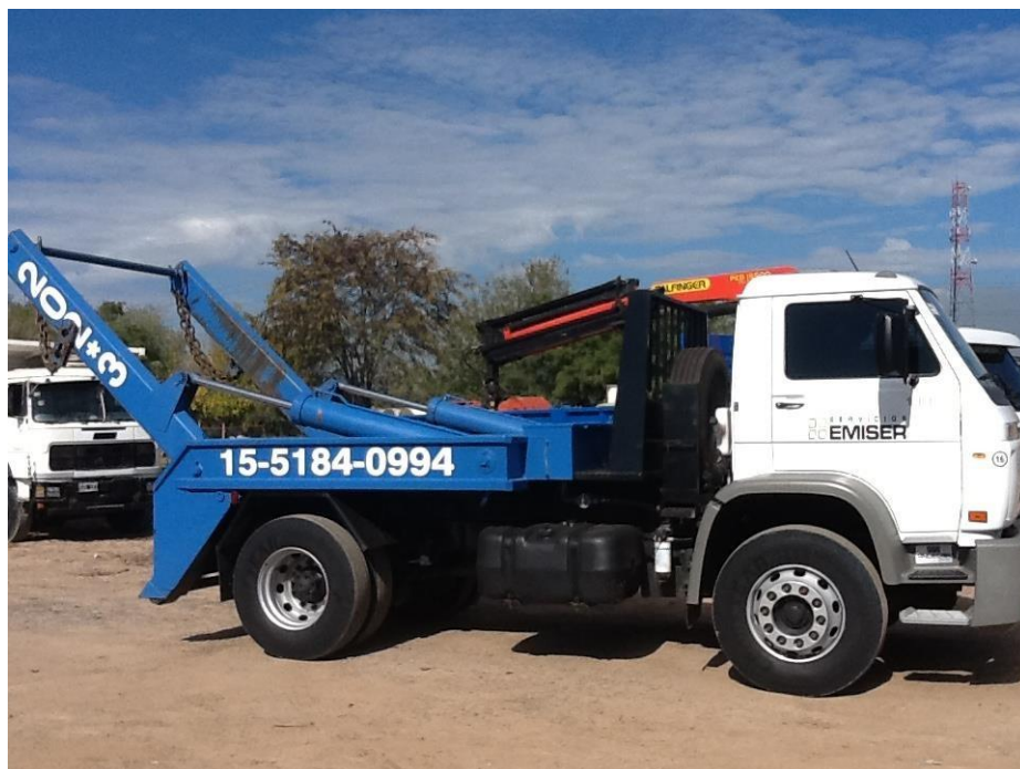
Camión Volkswagen 13-180 con equipo porta volquete modelo 2012