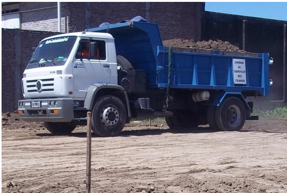
Camión volcador Volkswagen 13-180 modelo 2010