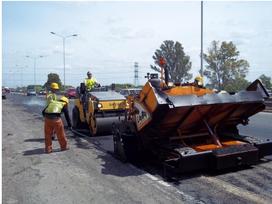
Terminadora de asfalto Leeboy 2011 – Rolo liso combinado Sakai 2011