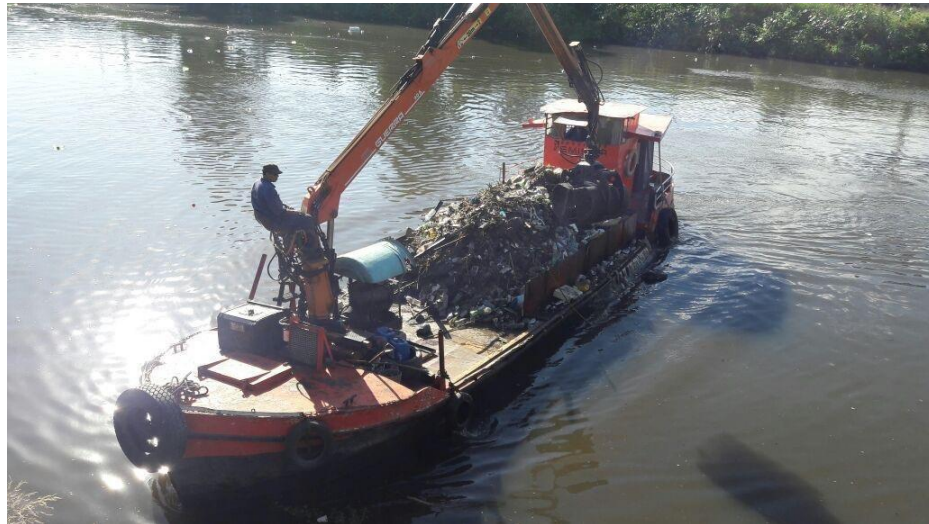
Barco PLAYERA III con hidrogrúa y balde almeja