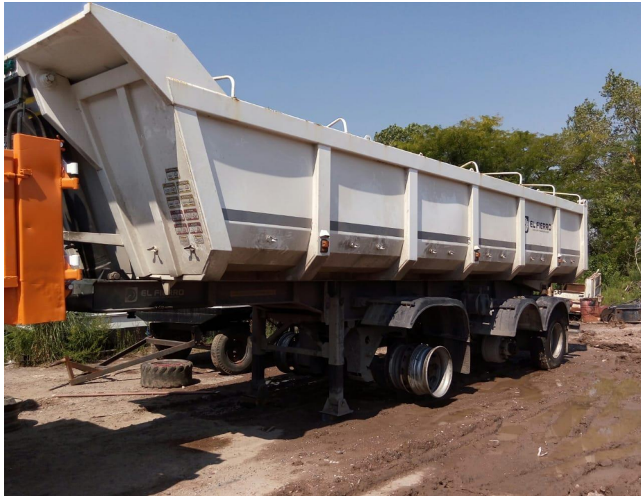
Batea El Fierro